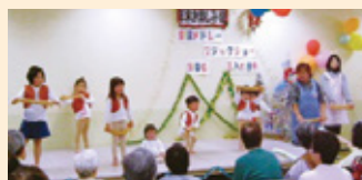
熱川温泉病院 保育所